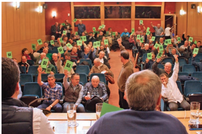
Tanto el Informe Sindical como la Ponencia de Política Agraria fueron aprobados por unanimidad.