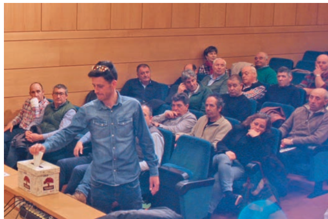
Por último, la afiliación eligió a la Comisión Permanente que dirigirá el sindicato hasta el próximo Congreso.