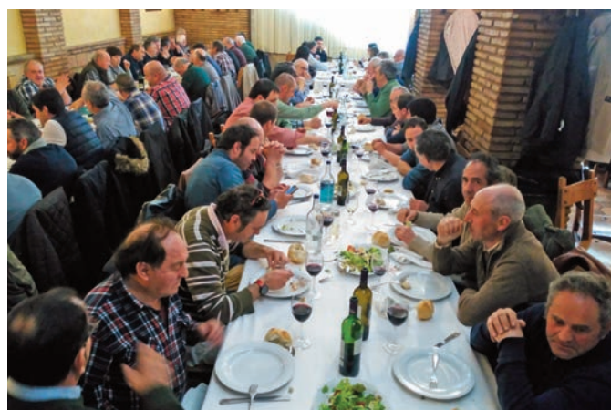
Una comida rica y abundante en el Mesón Cid puso fin al Congreso.